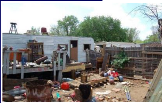
Áreas No Incorporadas no Tienen Códigos para ser Reguladas

El Condado de Dallas está evaluando la implementación de un nuevo código que permitiría al Jefe de Bomberos del Condado de Dallas regular las reglamenta-