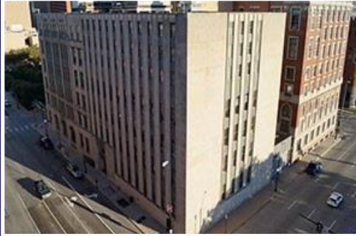
El Complejo de Registros del Condado de Dallas